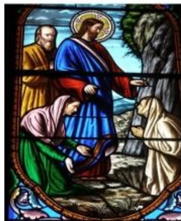
Apparition aux femmes - vitrail, église d'Arthuis