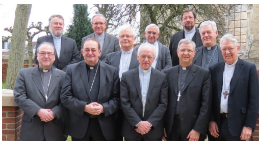
Conférence épiscopale belge

Ce n'est pas aux prêtres à poser leur candidature. Les évêques en fonction ont obligation, soit en se concertant, soit isolément, d'indiquer au représentant du pape, le nonce, les noms de prêtres qu'ils jugent aptes à ce ministère. Il appartient au nonce de s'informer sur chacun d'eux, en interrogeant, avec précision et sous le sceau du secret, les personnes les plus à même de les connaître. Ces personnes peuvent être des prêtres, mais aussi des religieux ou religieuses et des laïcs. A chaque personne interrogée, il est demandé, en conclusion, un jugement synthétique : tel prêtre vous paraît-il apte à être évêque, et dans quel type de diocèse ? Chacun peut aussi don-